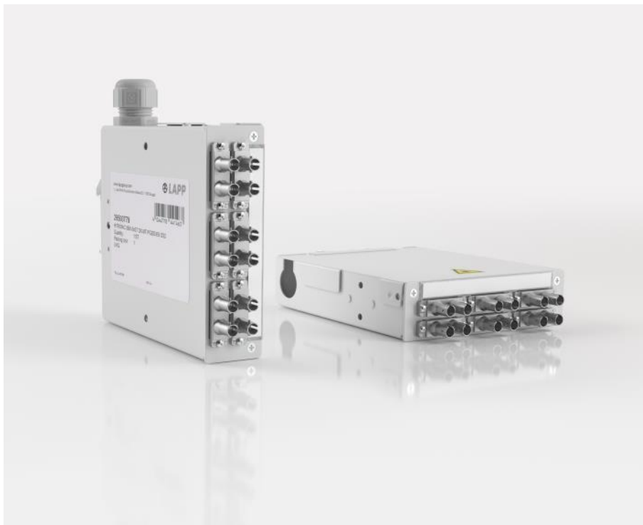
Bild 1: Die neue Generation der Spleißboxen von LAPP, HITRONIC SBX, ist aus robustem Metall.