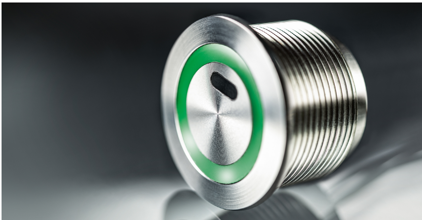
SCHURTER TTS: hochpräziser, berührungsloser Metal Line-Taster in optischer ToF-Technologie (Time of Flight)

Bitte, nicht berühren! Das muss nämlich gar nicht sein. Eine neue Generation von Tastern und Schaltern für berührungsloses Schalten wurde für genau diesen Zweck entwickelt. Schalten ohne Berühren. Schalten, ohne die Oberfläche mit potenziell schädlichen Viren oder Bakterien zu kontaminieren. Wie funktionieren und was können diese Taster?